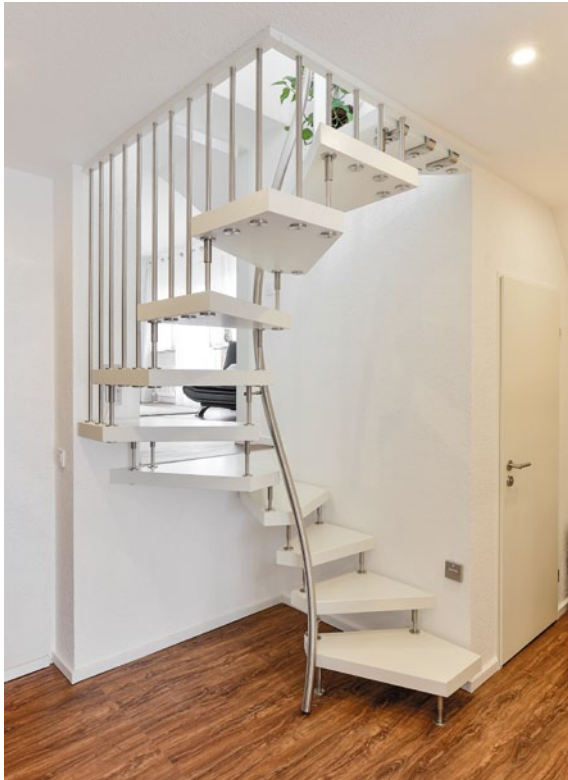
Die kompakte 1m 2 -Treppe von KENNGOTT im platzsparenden Telefonzellenformat eignet sich für Engstellen im Haus.

Treppe im Telefonzellenformat ist bequem und sicher begehbar