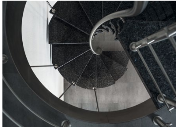
Sieht gut aus und gibt Halt: der spiralförmig gewundene und mittig platzierte Handlauf aus Edelstahl.