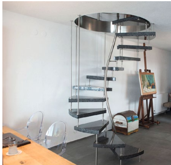
Im Gegensatz zu Samba- oder Einschubtreppen ist die fest verbaute 1m 2 -Treppe bequem und sicher begehbar.